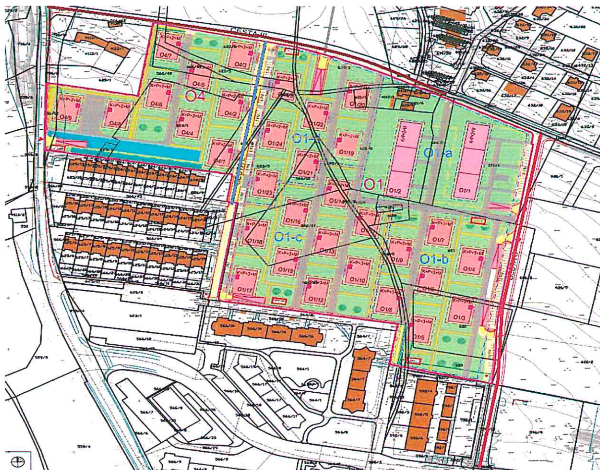
Opomba - prikaz potrebnega preštevilčenja