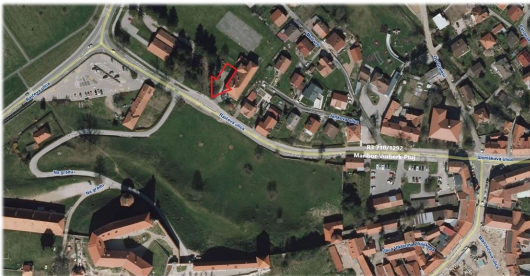
Slika 2: Lokacija obstoječega avtobusnega postajališča na Raičevi ulici (označeno z rdečo barvo)

Za izgradnjo novega avtobusnega postajališča, ki se predvideva ob državni cesti pod gradom na desni strani vozišča v smeri proti centru mesta, natančna lokacija še ni določena in bo določena s projektom in soglasjem DRSI.