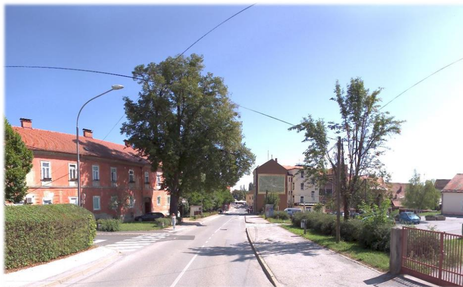
Slika 7: Predlagana lokacija izgradnje AP na Raičevi ulici v smeri centra Ptuj