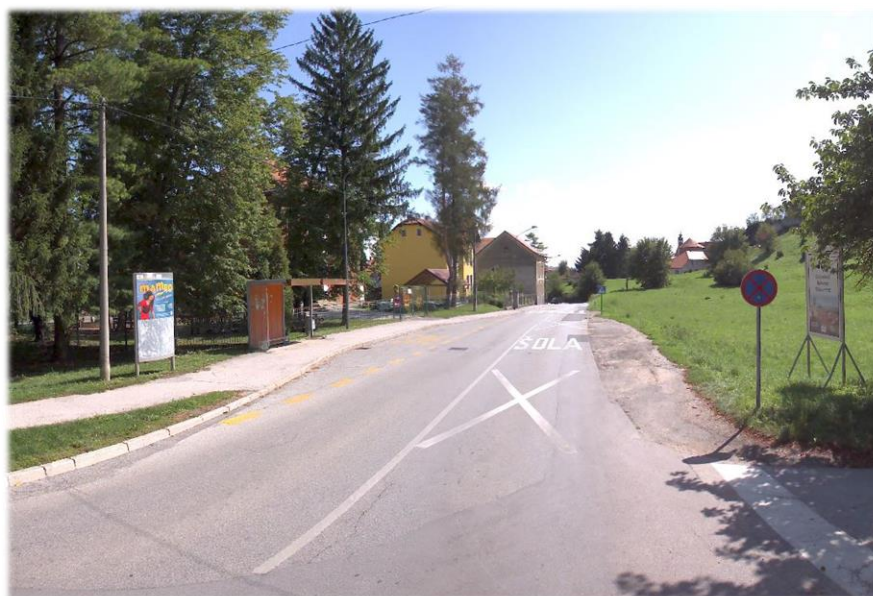
Slika 4: Odsek na lokaciji pod gradom v smeri center Ptuj