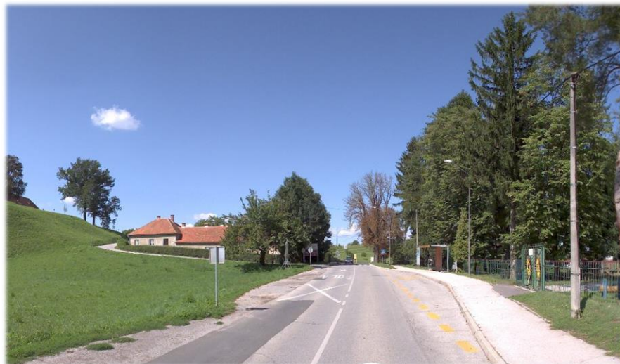
Slika 3: Odsek pod gradom iz smeri centra Ptuja