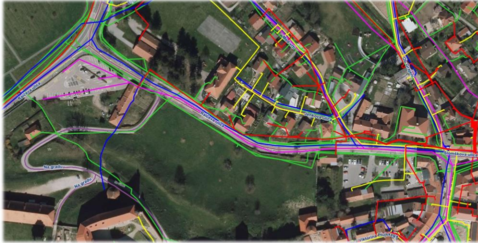
Slika 5: Gospodarska javna infrastruktura (energetika, komunala, komunikacije)

Na območju obdelave poteka gospodarska javna infrastruktura, kot je razvidno iz spodnje slike: