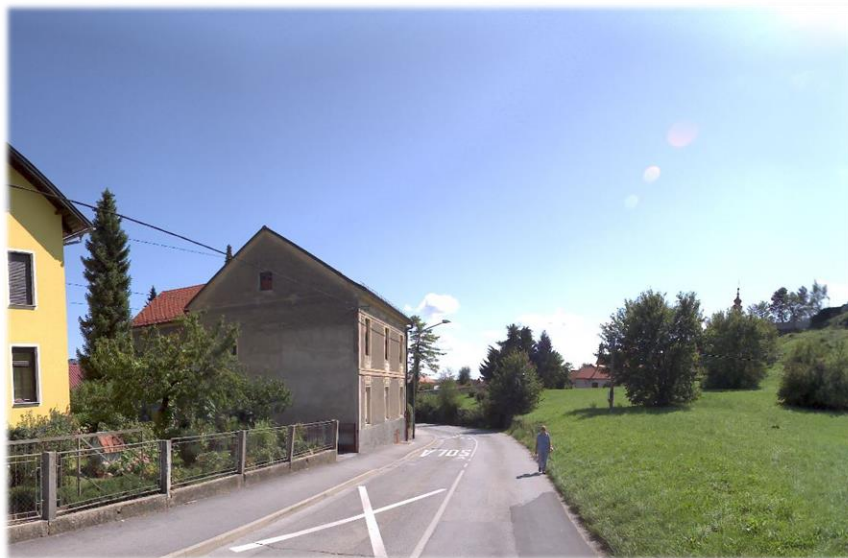
Slika 6: Predlagana lokacija izgradnje AP pod gradom v smeri centra Ptuj

Natančna lokacija bo določena s projektom in potrjena s strani Direkcije RS za infrastrukturo. Investitor predlaga dve varianti postavitve – mikrolokaciji. Prva varianta je lokacija ob regionalni cesti R3 710/1292 na stacionaži po BCP v km 24+135 (lokacija pod gradom, nasproti objekta h. št. Raičeva ulica 10). Druga varianta izgradnje avtobusnega postajališča je na predlagana na lokaciji ob regionalni cesti R3 710/1292 na stacionaži po BCP v km 24+265 (lokacija vzdolž objekta na Raičevi ulici v bližini h. št. 5).